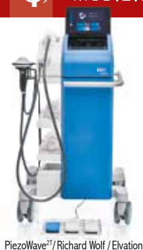
PiezoWave 2T / Richard Wolf / Elvation